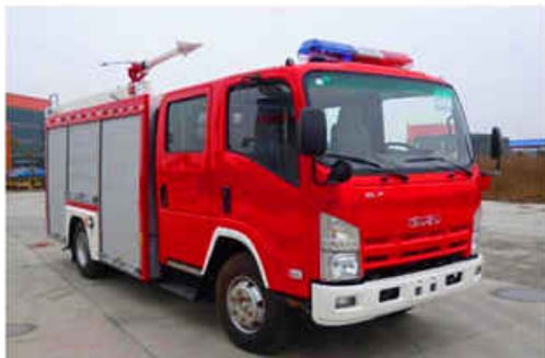
3000L Water & 1000L Foam ISUZU Fire Truck