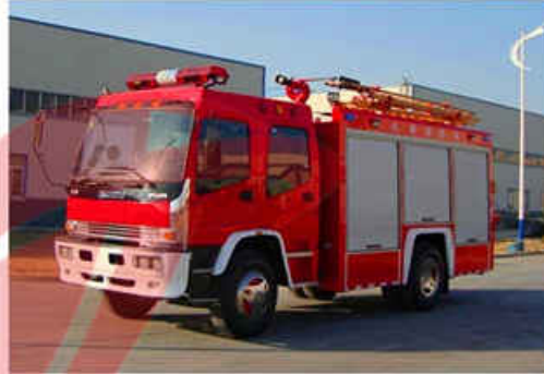
6000L ISUZU Foam Fire Truck