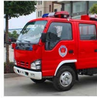
1500L Water & 500L Foam Fire Truck