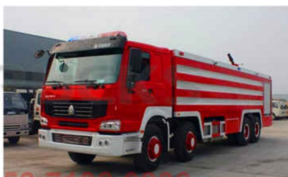
12000L Water & 3000L Foam SINOTRUCK Fire Truck