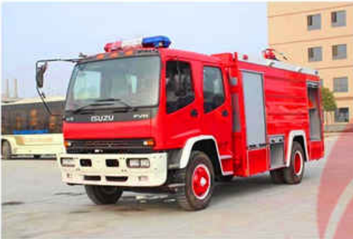
6000L ISUZU Water Fire Truck