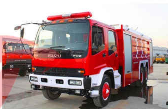
7000L Water & 2000L Foam ISUZU Fire Truck