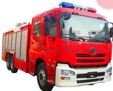
9-12CBM UD NISSAN Fire Fighting Truck