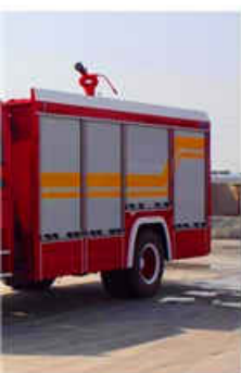
m ISUZU Fire Truck