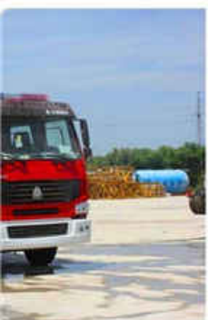
re Fighting Truck