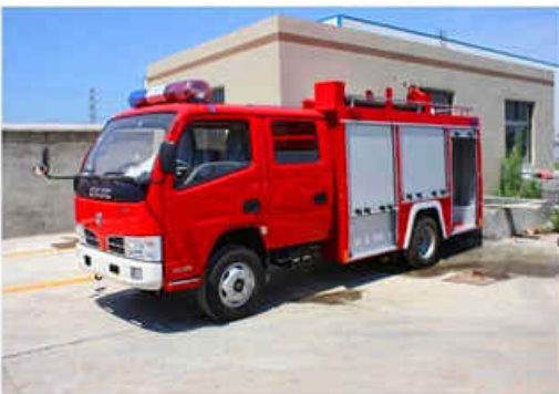
3000L DongFeng Water Fire Truck