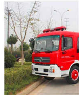
6000L Water & 2000L Foam Fire Truck