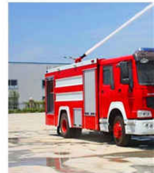
6000L SINOTRUCK Fire Fighting Truck