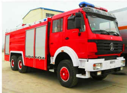
9-12CBM China Benz ( Beiben ) Fire Fighting Truck