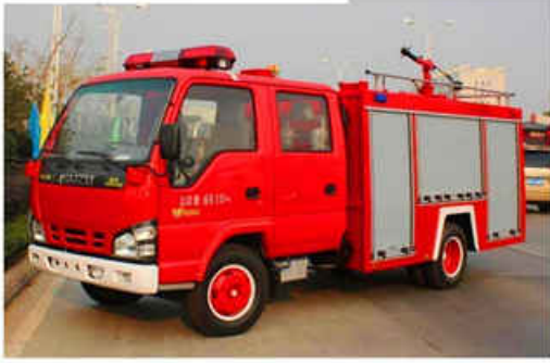
2000L ISUZU Water Fire Truck