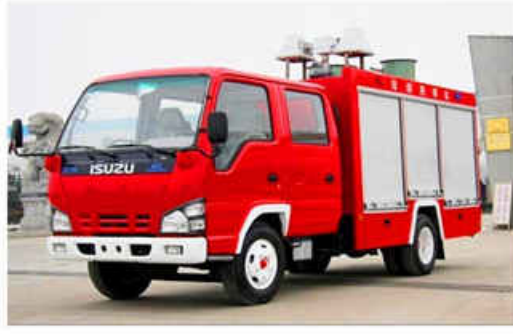
2000L ISUZU Foam Fire Truck