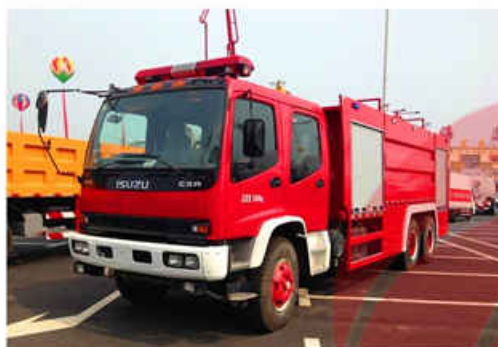
9000L ISUZU Water Fire Truck