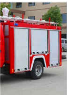
h ISUZU Fire Truck