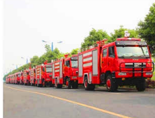
6000L Water FAW RHD Fire Truck