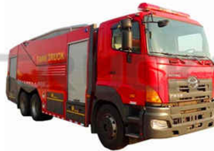
9-12CBM HINO Fire Fighting Truck