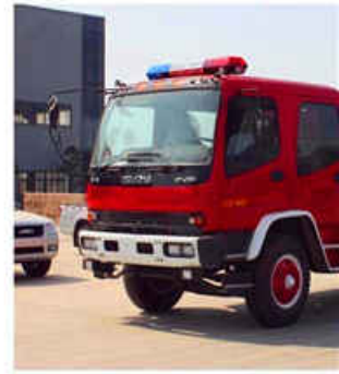
4000L Water & 2000L Foam Fire Truck