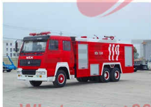
9000L SINOTRUCK Fire Fighting Truck