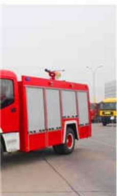
n DongFeng Fire Truck