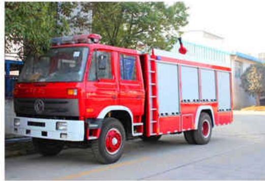
6000L DongFeng Water Fire Truck