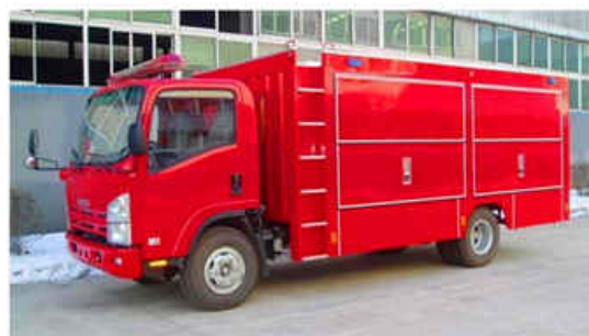
4000L ISUZU Chemical Rescue Truck